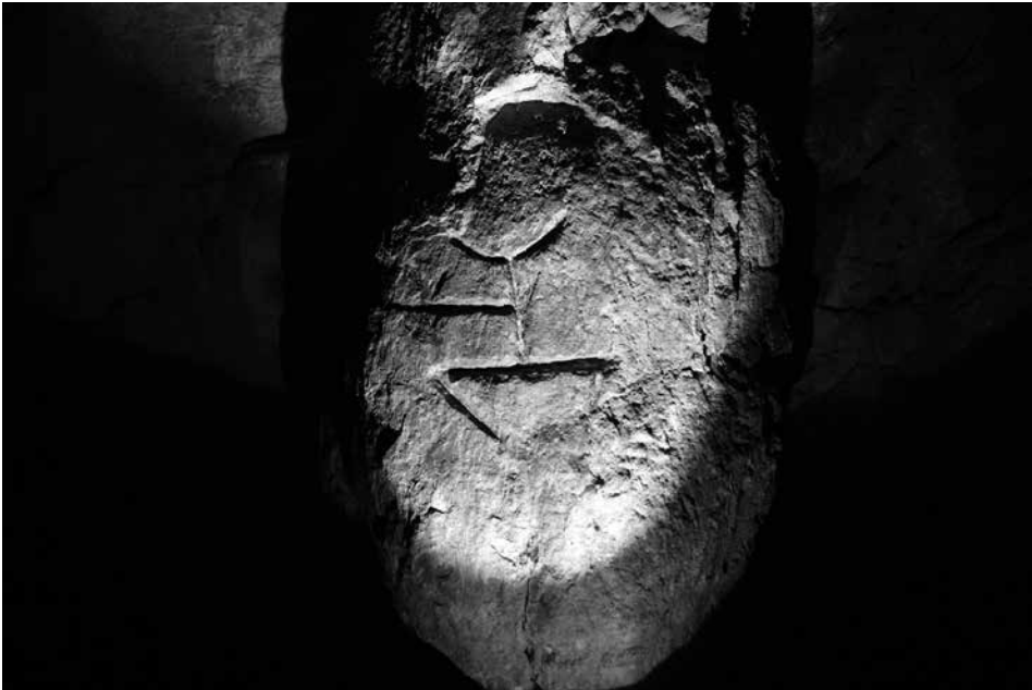
Slika 1: Falusoidna podoba kapnika s petroglifi iz Jame ob Trnovskem studencu nad Ilirsko Bistrico.

Zaradi oblike je najbolj vznemirljiv petroglif ta, ki deluje kot antropomorfini lik. Za razliko od preostalih petroglifov je edini, ki deluje skrbno, natančno in bolj globoko vrezan. Na prvi pogled resda deluje kot stiliziran strelec z lokom, pri čemer bi bili nogi stilizirani v razkoraku, okroglina glave zgolj nakazana, z iztegnjeno roko, v kateri si lahko